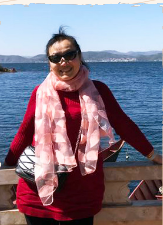
雍 琼 桂花园加油站加油员